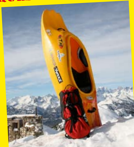
Le seul et unique proto de snow-kite-kayak qui existe au monde !