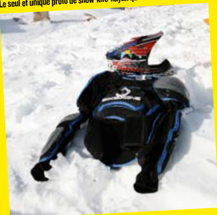
Une protection intégrale, comme on en utilise en moto-cross...

M i-décembre, la saison hivernal est toute proche. Les stations commencent à ouvrir, les riders en tout genre apparaissent ! Pour ce "Testing Zone" un comeback s'impose. Fin de saison d'hiver 2007, je rencontre un homme étrange qui m'explique avec insistance un nouveau concept de glisse : le SKK (snow-kite kayak). Je lui demande de me montrer son invention et après quelques échanges, il me promet de l'essayer l'hiver suivant. Nous y voilà, je me réveille un beau matin et je me souviens de cette phrase !